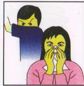
Tutup hidung dan mulut anda dengan menggunakan tisu / saputangan atau lengan dalam baju anda.