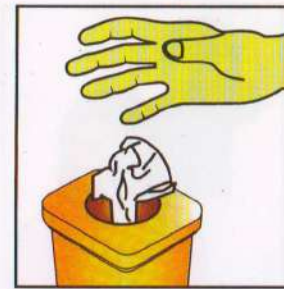
Segera buang tisu yang sudah dipakai ke dalam tempat sampah.